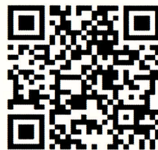
中區國稅局 臉書粉絲專頁